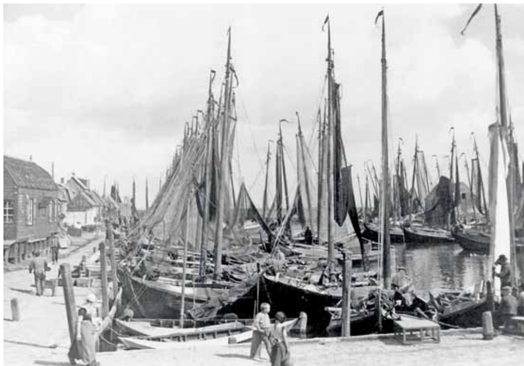
Overzicht op de nieuwe haven met een gedeeltelijk onbebouwde havendijk, ook hier de wrijfpalen.