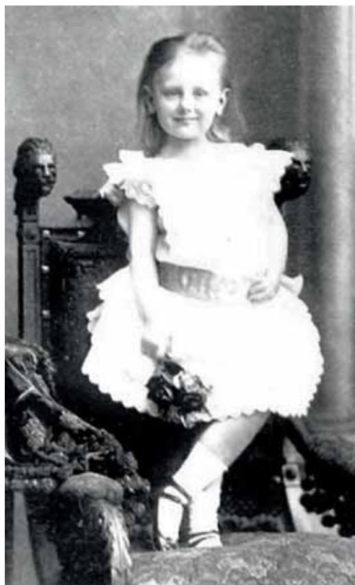
De jonge prinses Wilhelmina zoals om en nabij 1886.

vertrok. Dit om het tijdsbeeld te schetsen. Op 31 maart meldt de krant dat het werk aan de haven is begonnen en dat er niet alleen een nieuwe haven wordt gegraven, maar ook dat de bestaande haven en kades een opknappbeurt krijgen. In juni is er met grond uit de haven buitendijks 500 meter dijk aangelegd en verstevigd met stenen. De haven is al op diepte en men is bezig met het aanleggen van de fundering van de kades, waarop de zogenaamde troggewelven en kubbesteilen worden geplaatst. De benaming troggewelf wordt gebruikt voor het type ronding en kubbesteilen waren de stalen dragers waartussen gemetseld werd. Ook zijn in deze maand de havendammen klaar. Dit alles door het zeer goede weer en de waterstand. In september meldt de Nieuw Amersfoortse Courant dat hare majesteit koningin