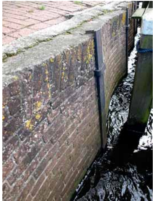
De kade in de huidige staat, ter hoogte van het clubhuis van WSV de Eendracht.

doordat de vissers hun afzetmarkt zagen vergroten. Tien jaar voor de aanleg van de haven was het aantal schepen al opgelopen tot meer dan 170, een heel aantal voor de kleine steeds dichtslibbende kom. Tijd voor actie, zo dachten de schippers. Men begon te lobbyen zoals dat op de dag van vandaag nog steeds gedaan wordt als men een project van stapel wil laten lopen. Enige jaren zijn er overheen gegaan om de plannen rond te krijgen voor een nieuwe haven. Er was eerst het plan om aan de westzijde van de haven een haven aan te leggen maar dit werd helaas afgeketst door het Ministerie van Oorlog, dat aan die zijde een schans had liggen die wij nu kennen als de Oude Schans. Het stuk aan de oostzijde van de haven lag braak en was nog niet eens omdijkt. Rond 1880 werd de gemeente door de vissers opgeroepen om werk te maken van de aanleg van de Nieuwe Haven. Burgemeester Wouterus Beukers houdt zich bezig met het plan en begint in 1883 met de voorbereidende werkzaamheden en, ook toen al, met het