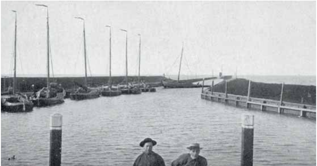
Overzicht van de pieren en de kade (rechts) met originele wrijfpalen, foto gemaakt tussen 1900 en 1905.