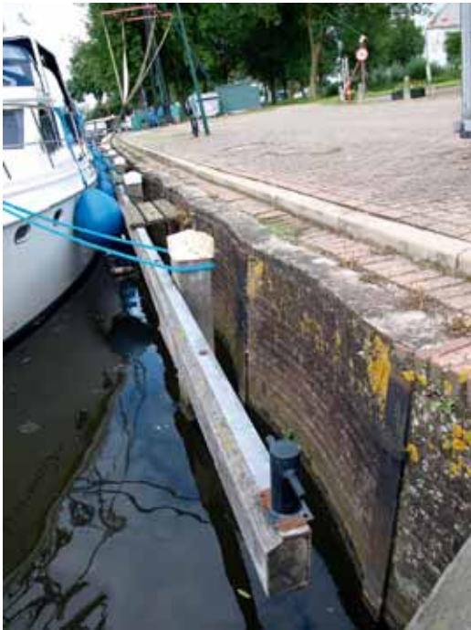
De kade ter hoogte van de botenkraan, hier is de schuinestrektijl goed te zien.